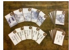
伊勢湾台風 カルタ